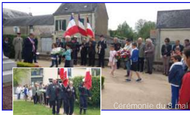
Cérémonie du 8 mai