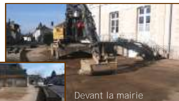
Devant la mairie

La mairie sera bientôt accessible aux Personnes à Mobilité Réduite également. Un élévateur prendra place en façade, c'est pourquoi le massif devant la mairie a été supprimé et un bel aménagement sera proposé.