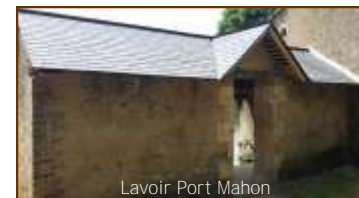
Lavoir Port Mahon

Courant mai, il a été procédé au dé-moussage de la toiture en tuiles de l'église et à la réfection complète de la toiture du lavoir rue du Port.