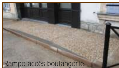
Rampe accès boulangerie

La commune étant propriétaire des murs de la boulangerie, des travaux d'accessibilité de ce commerce ont été réalisés conformément à la réglementation.