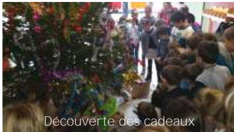
Découverte des cadeaux