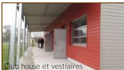
Club house et vestiaires

Les nouveaux locaux au stade municipal sont terminés. Il reste néanmoins l'aménagement extérieur à finir : clôture, rambarde, main courante... avant d'inaugurer ce lieu courant septembre.